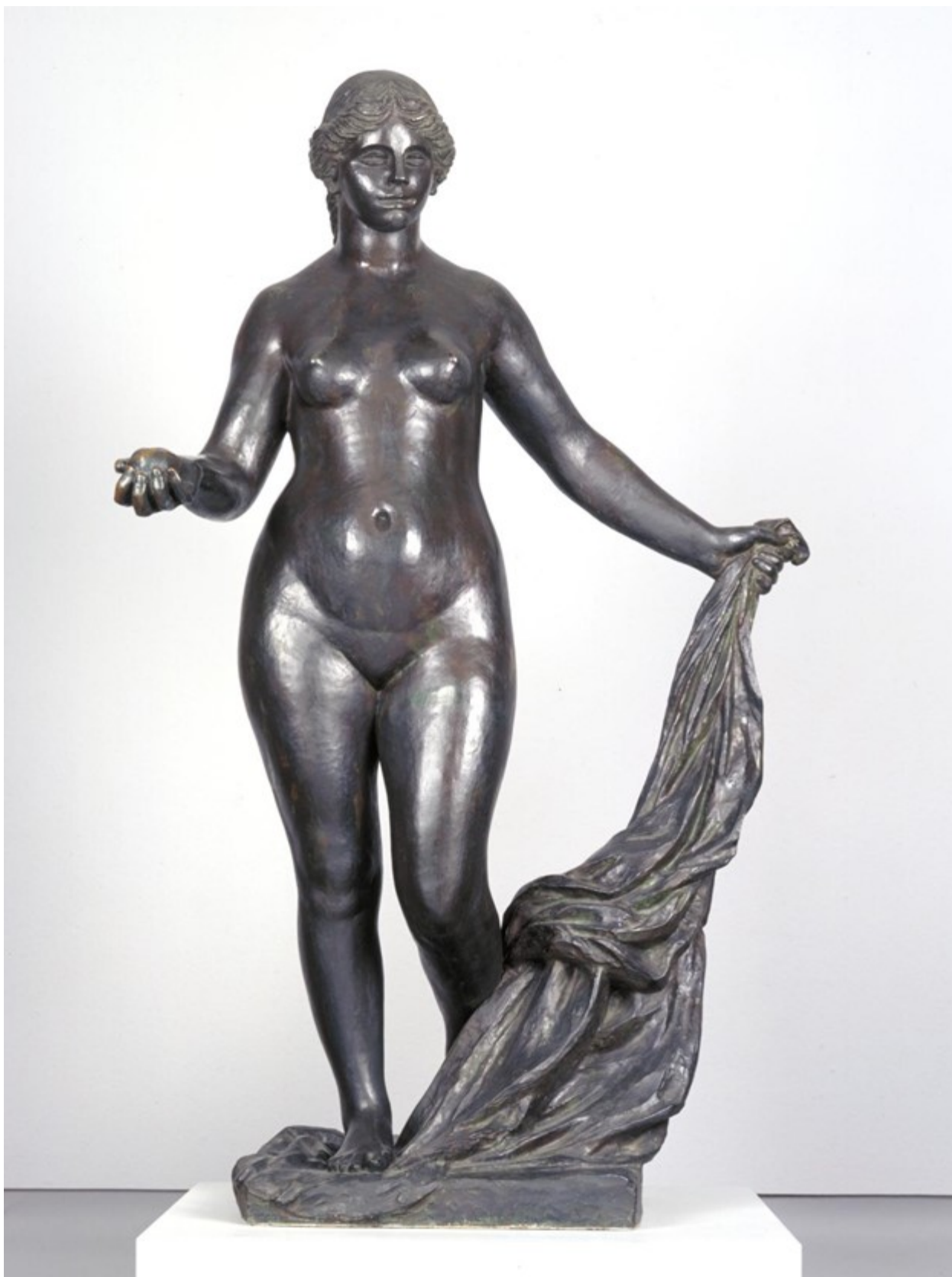
2. Огюст Ренуар. Венера Победоносная. Ок. 1914